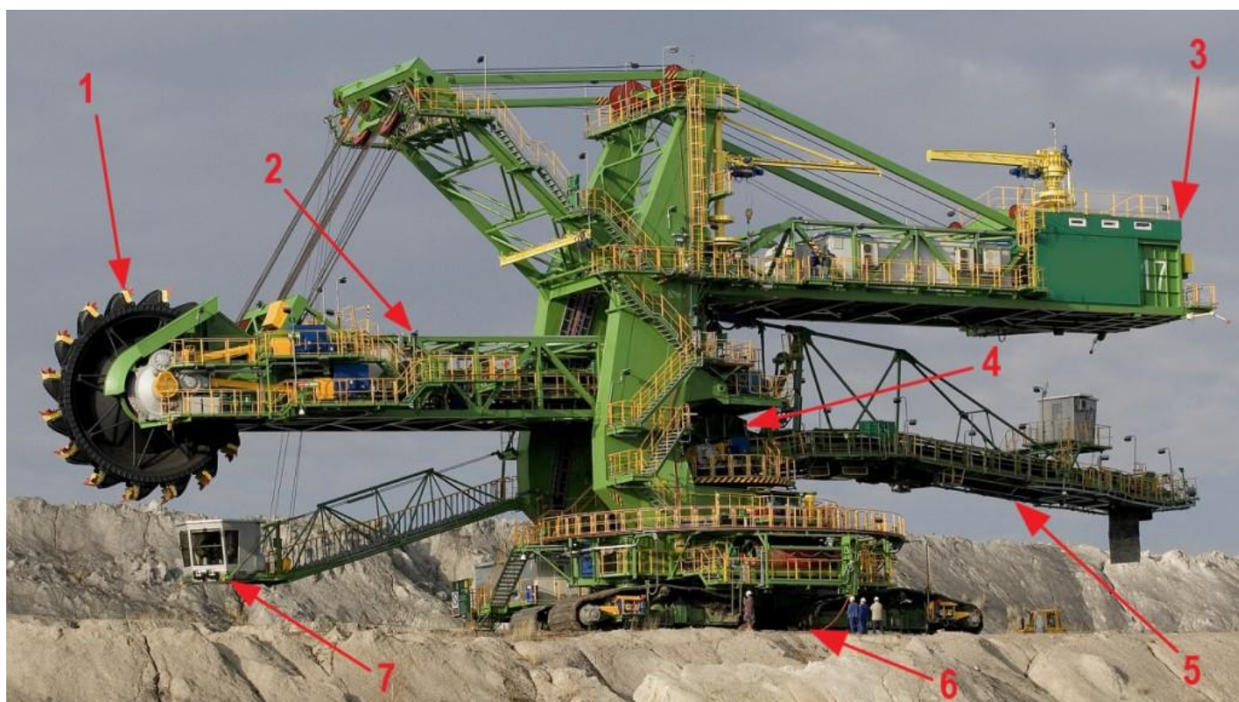
Rysunek 2. Budowa koparki wielonaczyniowej kołowej