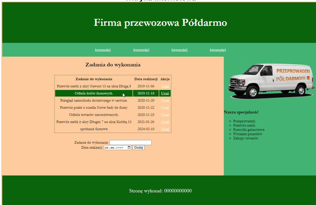
Ilustracja 2. Wygląd witryny internetowej. Kursor myszy na trzecim wierszu tabeli