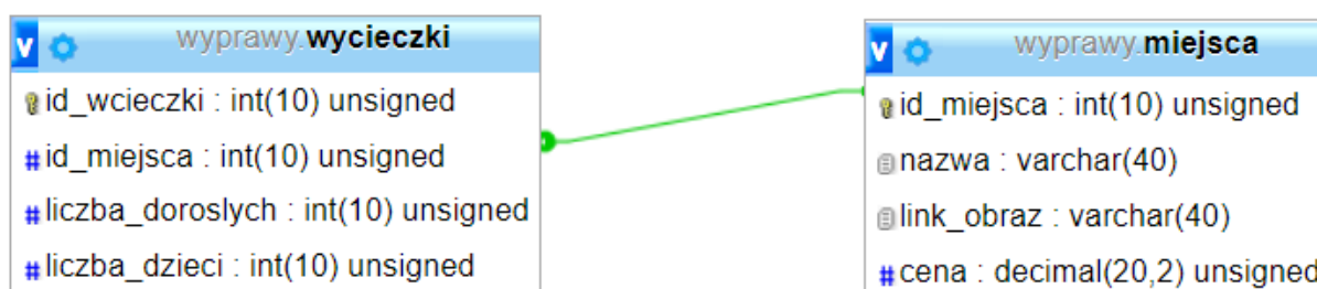
Ilustracja 1. Baza danych

Baza danych zawiera połączone relacją tabele przedstawione na ilustracji 1.