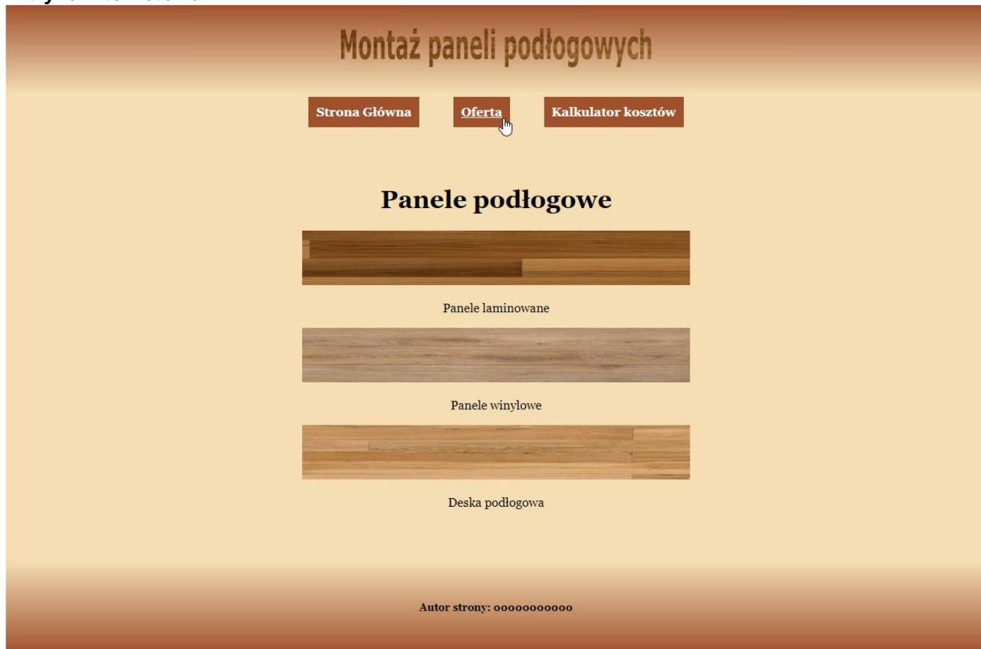
Ilustracja 3. Strona index.html , kursor na drugim odnośniku