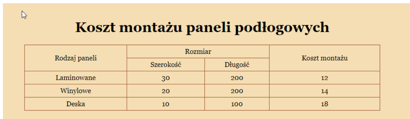
Ilustracja 4. Fragment bloku głównego strony oferta.html

Zawartość bloku głównego strony koszty.html :