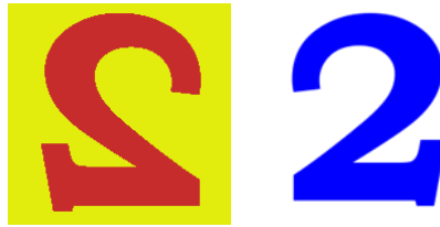
Ilustracja 2. Efekt przekształcenia obrazu z pliku 2a.png do 2.png

Przygotowanie animacji o nazwie cyfry.gif :