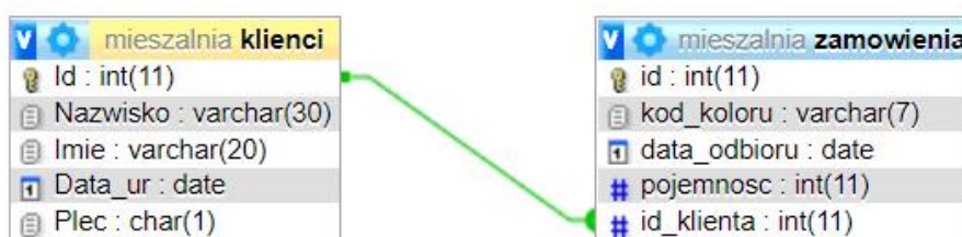
Ilustracja 1. Baza danych

Do wykonania operacji na bazie należy wykorzystać przedstawione na ilustracji 1 tabele. Tabele klienci i zamowienia tworzą relację jeden do wielu.