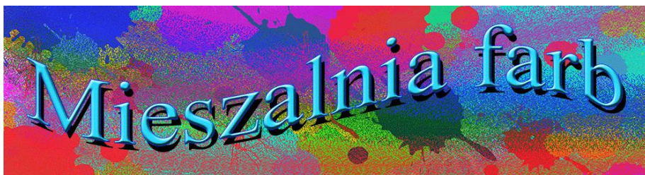
Ilustracja 2. Baner strony