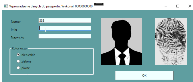
Obraz 3. Po opuszczeniu pola edycyjnego „Numer”

Na obrazie 1 przedstawiono ideę aplikacji desktopowej. W zależności od użytego środowiska programistycznego wygląd może nieznacznie się różnić.