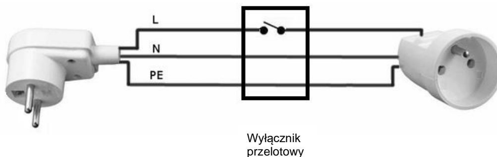
Rysunek 1. Schemat przedłużacza sieciowego z wyłącznikiem przelotowym

Stanowisko wspólne znajdujące się w sali egzaminacyjnej zostało wyposażone w lampę sollux. Zainstalowana lampa nie posiada wyłącznika sieciowego. Wykonaj kabel zasilający przedłużający oryginalny przewód zasilający lampę z wyłącznikiem, zgodnie ze schematem zamieszczonym na rysunku 1 . W tym celu wykorzystaj znajdujące się na stanowisku indywidualnym: wtyczkę sieciową, gniazdo, wyłącznik na przewód oraz przewód OMY 3 x 0,75 mm 2 . Na zakończeniach przewodów po stronie wtyczki i gniazda usuń izolację zewnętrzną kabla, oraz izolację na przewodach i zamontuj nieizolowane tulejki kablowe. W miejscu instalacji wyłącznika należy zdjąć izolację zewnętrzną kabla, przeciąć tylko przewód L, odizolować końcówki na przeciętym przewodzie, zamontować nieizolowane tulejki kablowe i zamocować wyłącznik. Zgodnie z ogólnie przyjętą zasadą, zastosuj odpowiedni kolor przewodu dla poszczególnych linii zasilających oraz ochronnej, a wyniki zanotuj w tabeli 1 .