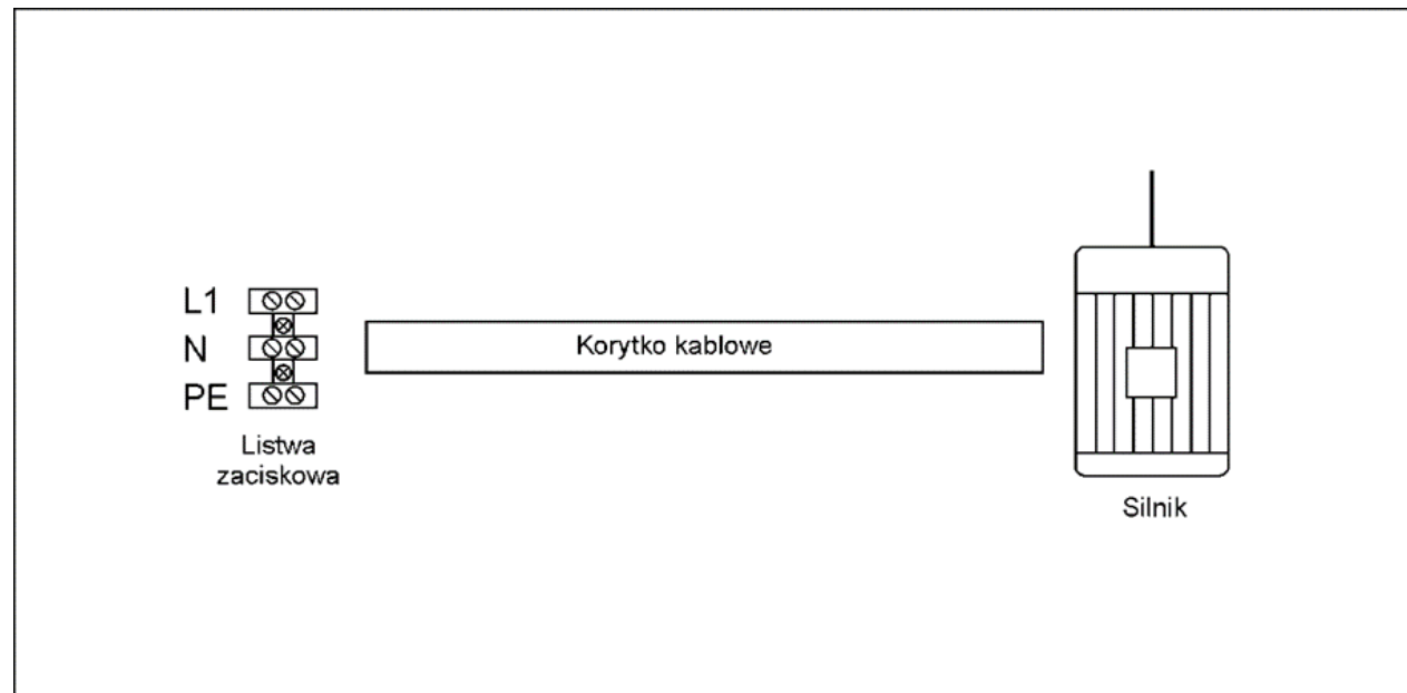
Rysunek 2. Rozmieszczenie elementów układu elektrycznego