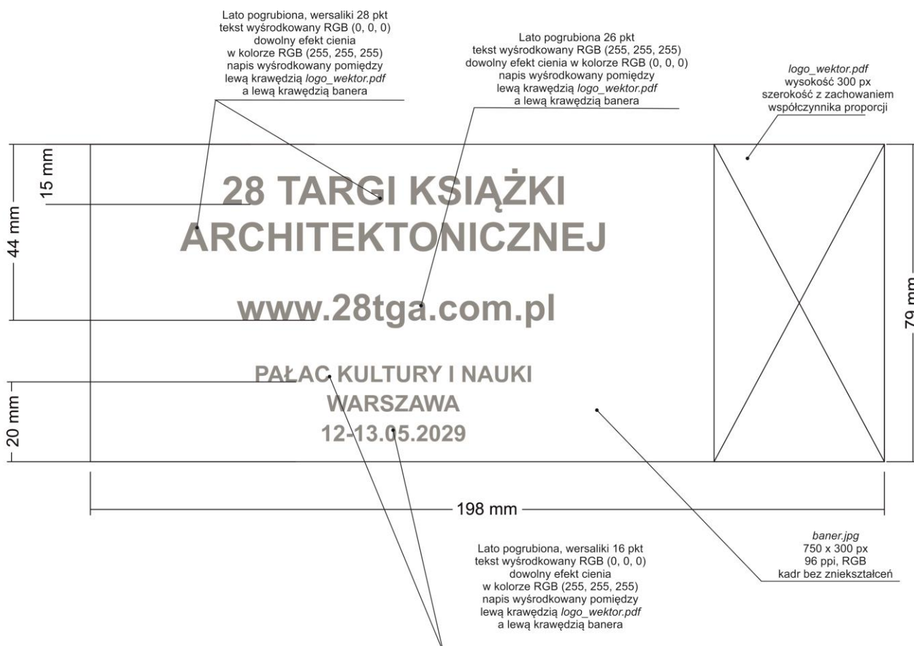
Rysunek 2. Makieta banera