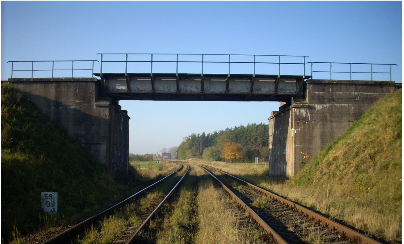
Ilustracja 1. Kolejowy obiekt inżynierski w km 104,000 linii kolejowej nr 201