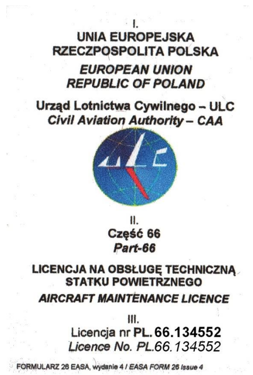
Rysunek 3. Licencja mechanika lotniczego

Czas przeznaczony na wykonanie zadania wynosi 180 minut.