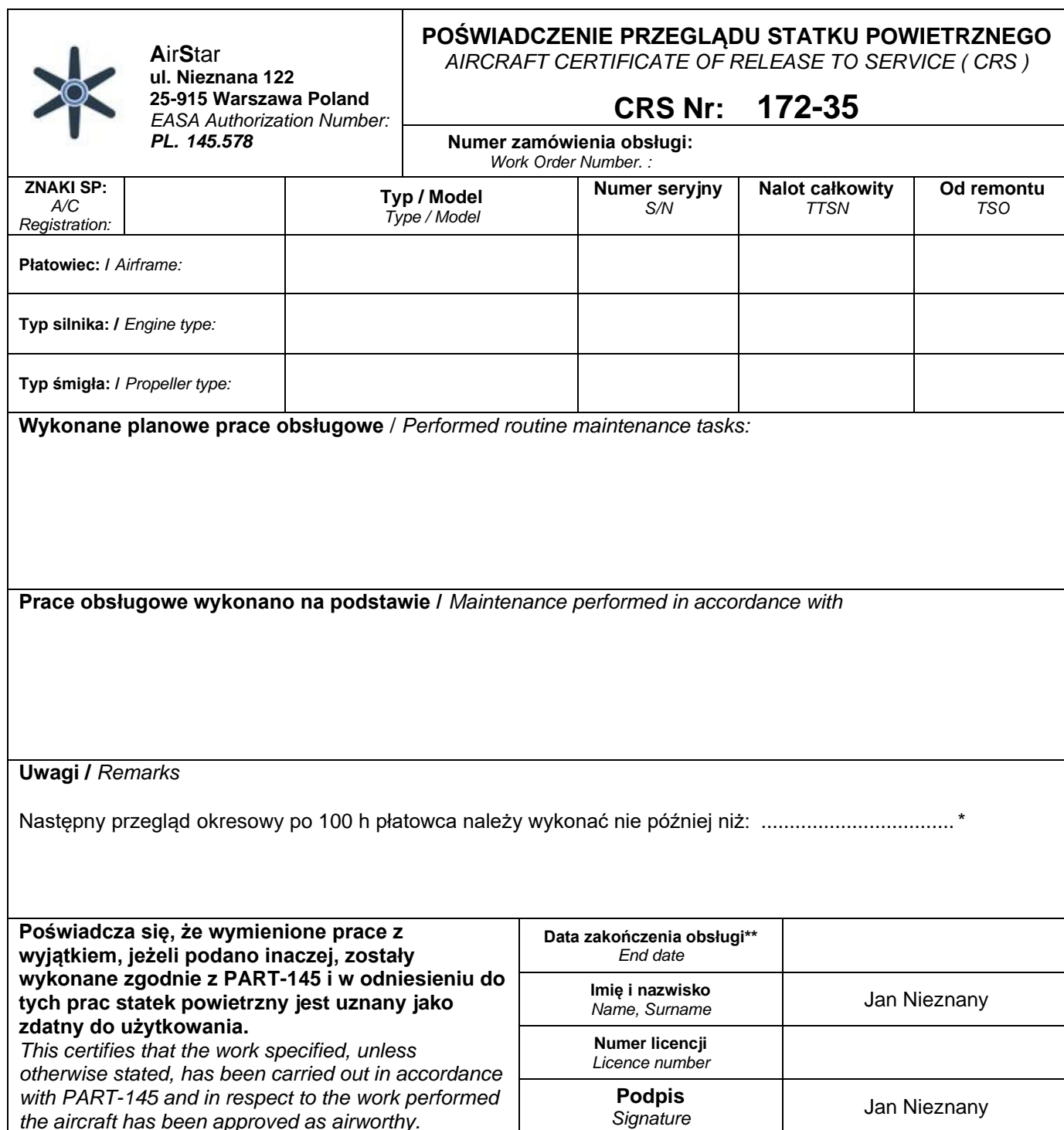
Tabela 14. Poświadczenie wykonania przeglądu statku powietrznego

*Wpisz liczbę godzin i minut do której należy wykonać następną obsługę okresową